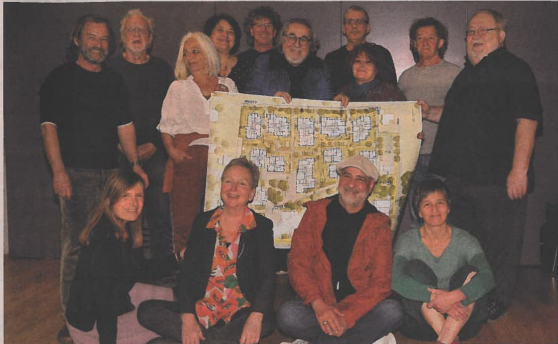
Für das Wohnbauvorhaben hat sich eine bunte Truppe formiert: derzeit treffen sich die „Silberstreif“-Mitglieder, um in kleineren Arbeitskreisen die anstehenden Aufgaben zu bearbeiten.

Für „Silberstreif“ stehen 26 der insgesamt 250 Wohnungen zur Verfügung, 22 sind bereits reserviert. Die Wohnungen haben 43 bzw. 85 Quadratmeter für Einzelpersonen und Paare. „Für unsere neue Art des Zusammenlebens – jede Person hat seine eigene abgeschlossene Wohnung, aber es gibt auch eine große Küche sowie einen Dachgarten, wo wir ge-