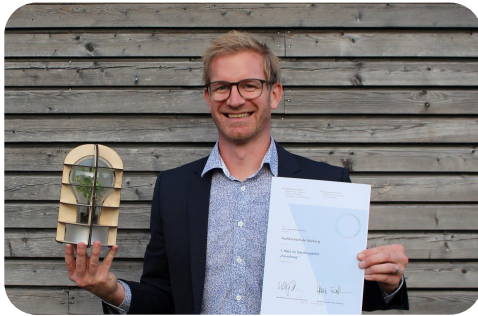
2021: Sustainability Award Preisträger: FH Salzburg 1. Platz im Handlungsfeld „Forschung“