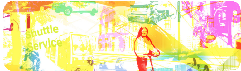
2021: VCÖ-Mobilitätspreis Salzburg Preisträger: Stadt Salzburg Prämiert als vorbildliches Projekt